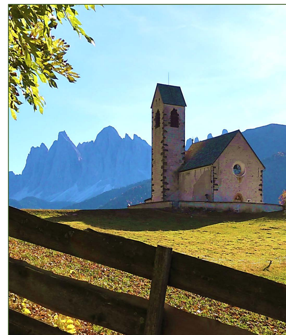
Villnösstal - Geislerspitzen